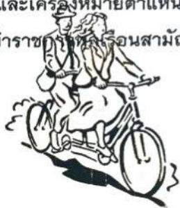
ไฟล์เอกสาร

การแต่งกายด้วยเครื่องแบบข้าราชการ ข้าราชการทุกคนต้องปฏิบัติตาม กฎสำนัก นายกรัฐมนตรีฉบับที่ ๙๔ (พ.ศ. ๒๕๕๓) และได้ประกาศในราชกิจจานุเบกษา เล่ม ๑๒๗ ตอนที่ ๒๔ ก เมื่อวันที่ ๓๐ เมษายน ๒๕๕๓ ให้ข้าราชการพลเรือนสามัญ สามารถใช้เครื่องหมายตำแหน่งบนอินท รัณูที่แก้ไขเพิ่มเติมตามระดับตำแหน่งใน แต่ละประเภทตำแหน่งตามพระราชบัญญัติ ระเบียบข้าราชการพลเรือน พ.ศ. ๒๕๕๑ ตั้งแต่วันที่ ๓๐ เมษายน ๒๕๕๓ เป็นต้นไป โดยใช้อินทรัณูและเครื่องหมายตำแหน่งบ นอินทรัณูของข้าราชการพลเรือนสามัญ